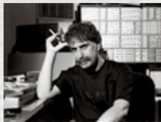
Frank Zappa, Filmstill aus Die Rache der toten Indianer, 1993