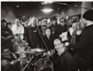
Cage Against the Machine, 2010