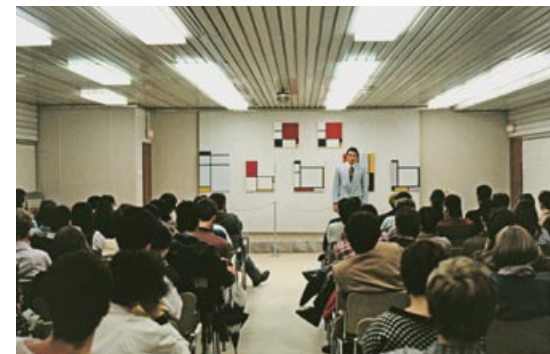
Walter Benjamin, Mondrian '63-'96 , 1986

A cooperative project by Hartware MedienKunstVerein, Dortmund, and KW Institute for Contemporary Art, Berlin, History Will Repeat Itself is the first comprehensive exhibition project on the subject of re-enactment in Germany. It takes place in the spectacular, 2.200 square meter large PHOENIX Halle built in 1895 on the area of the former steelworks of Phoenix-West which HMKV uses as an exhibition space since 2003.